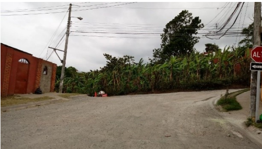
Imagen 2 Mejora de la capa base en Lomas de Cabeara