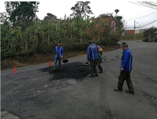
Imagen 7 Colocación de MAC en la salida de Lomas de Cabeara