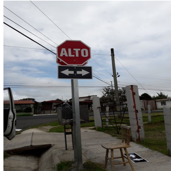
Imagen 4 Señal vertical entronque Calle Nueva y Calle La Torre