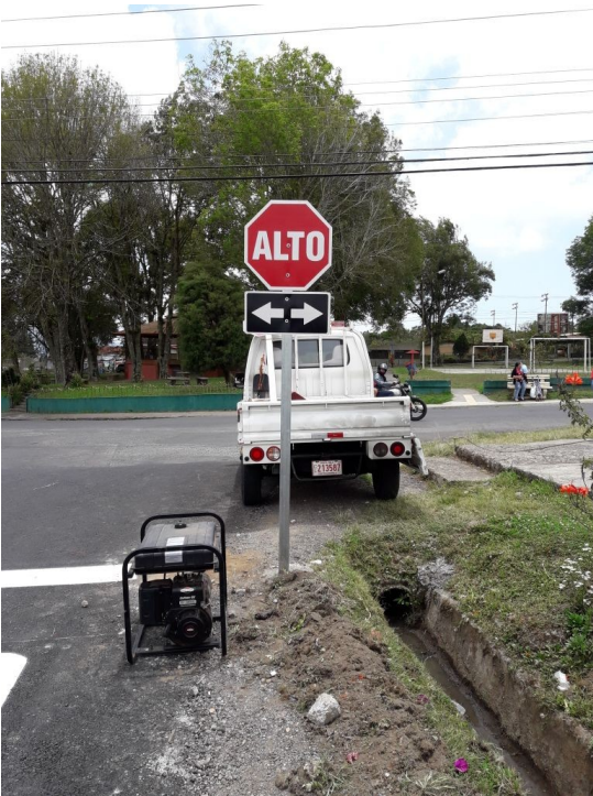
Imagen 3 Demarcación vertical Calle La Torre