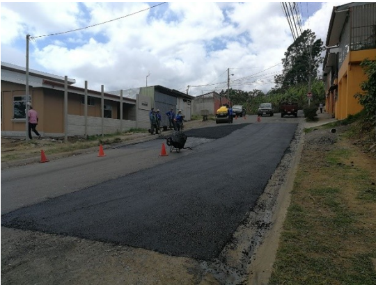
Imagen 6 Colocación de MAC en la salida de Lomas de Cabeara