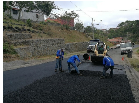
Imagen 5 Colocación de MAC en la salida de Lomas de Cabeara

Hagamos de Moravia una verdadera comunidad