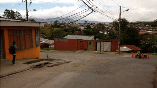
Imagen 1 Reparación salida lomas de Cabeara a terminal AMSA